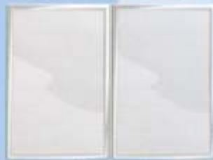
PUERTAS SÓLIDAS TRASERAS